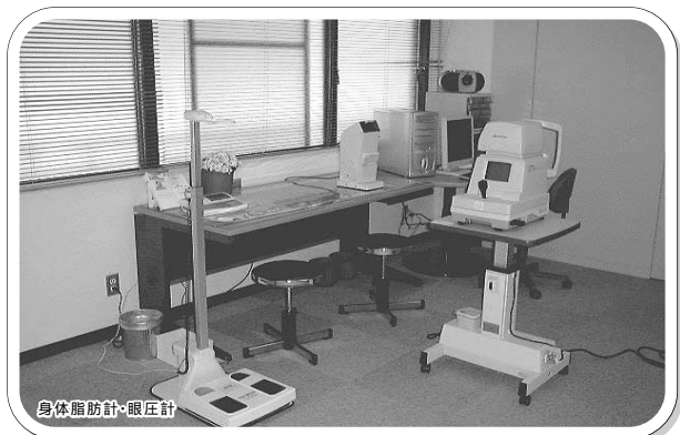
身体脂肪計・眼圧計