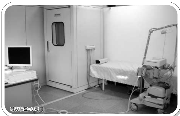
聴力検査・心電図