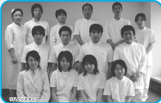
リハビリスタッフ

リハビリテーション科は、理学療法士・作業療法士・言語聴覚士で構成され、理学療法は、主に運動を行うことで体の動き・働きを維持・向上することを目標とします。日常生活に必要となる基本動作（起き上がり・立ち上がり）および移動動作の獲得を目指し、毎日の生活をよりスムーズ