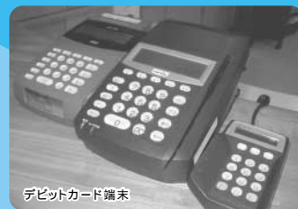
デビットカード端末

岩砂病院・岩砂マタニティでは、現金以外にもデビットカード・クレジットカードのご利用が可能です(夜間・休日は除く)。デビットカードとは、患者様がお持ちの銀行・郵便局のキャッシュカードで、外来診療費や入院費などのお支払いができるものです。ご利用方法は、暗証番号を入力するだけ(署名は不要)で支払金額が患者様の口座から即時に引き落とされます。患者様には手数料等は一切かかりません。岩砂マタニティについては平成15年11月に日本医師会が推奨する医事端末とデビットカード端末を導入いたしました。端末が設置されている病院は全国でも20ヶ所程、東海3県では当院だけと言うことでNHK名古屋放送局より取材を受け、「ニュース番組 ほうとイブニング」でも紹介されました。お産や入院など、高額になりますと盗難・紛失が心配されますのでぜひご利用下さい。