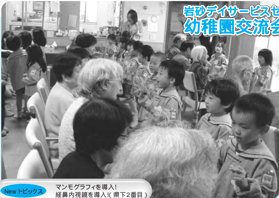
岩砂デイサービスセンター 幼稚園交流会にて