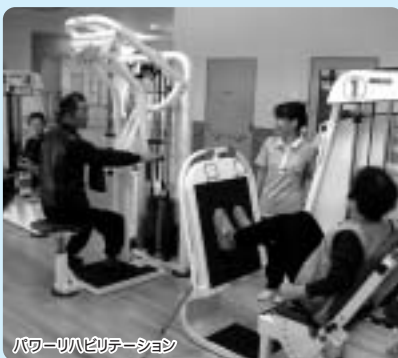
パワーリハビリテーション