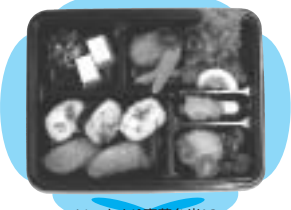
いつもより豪華弁当!