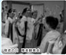
敬老の日 雅楽鑑賞会

19日(祝) 敬老会を行いました。午前中はデイサービスにて雅楽の演奏会を鑑賞し、午後はグリーンホーム各ユニットにてちらし寿司をいただきました。