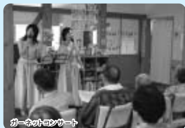
ガーンネットコンサート

4月 6・13日 「春の散策(お花見ツアー)」(畜産センター) 畜産センターまでドライブし、桜を見物してきました。現地ではみたらし団子をみんなまでおぼり、笑顔のまぶしいひと時を過ごせました。