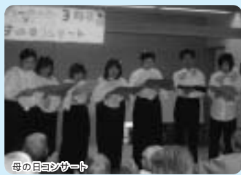
母の日コンサート

金華山のふもとの日中友好公園の桜を見に出かけました。朝から忙しくお弁当作り。桜を眺めながら野外で食べたお弁当は格別の味！家族の皆様も参加され、ゆったりした時間を過ごすことができました。