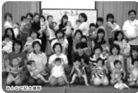
みんなで記念撮影

岩砂っ子集まってるね * 生後5ヶ月頃のお子さんと初めて出産されたお母さんに、集まっていたいています。このころの赤ちゃんは、寝返りをうつたり、目でものを追ったりし始めるので、その成長に合わせた手作りのおもちゃで実際に遊び、お子さんとの関わり方のヒントとして提供しています。