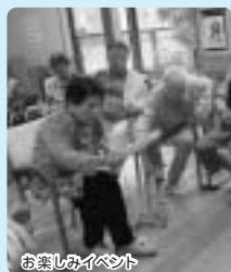
お楽しみイベント